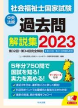
社会福祉士国家試験 過去問解説集 2023 請求記号: 369.17||N71