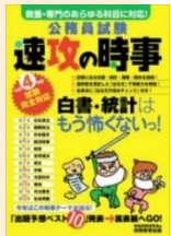
公務員試験速攻の時事 令和4年度試験完全対応 請求記号: 317.4||Sh33

また、KinoDenでは、就職活動対策本の電子ブックを利用することができます。その他の新着本や図書館所蔵図書は、ブックログから確認できます。