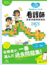
クエスチョン・バンク 看護師国家試験問題解説 2023 請求記号: N039||67