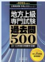
地方上級専門試験 過去問 500 2023 年度版 請求記号: 317.4||Sh33