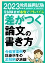
教員採用試験差がつく論文の書き方 2023 年度版 請求記号: 373.7||Sh33