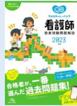
クエスチョン・バンク 看護師国家試験問題解説 2023 請求記号: N039||67