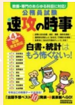
公務員試験速攻の時事 令和4年度試験完全対応 請求記号: 317.4||Sh33

また、KinoDen では、就職活動対策本の電子ブックを利用することができます。その他の新着本や図書館所蔵図書は、ブックログから確認できます。