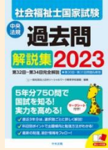
社会福祉士国家試験 過去問解説集 2023 請求記号: 369.17||N71