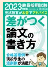
教員採用試験差がつく論文の 書き方 2023 年度版 請求記号: 373.7||Sh33