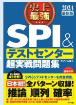
史上最強 SPI&テスト センター超実戦問題集 2024 最新版 請求記号: 307.8||O19