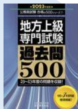
地方上級専門試験 過去問 500 2023 年度版 請求記号: 317.4||Sh33